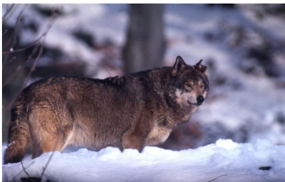
Wolf ( Canis lupus )

in der Schweiz und Deutschland unter nationalem Recht und ist durch die „Berner Konvention zur Erhaltung der europäischen, wild lebenden Pflanzen und Tiere und ihrer natürlichen Lebensräume“, wo er im Anhang II gelistet ist, streng geschützt. Der Wolf ist unter dem Washingtoner Artenschutzübereinkommen CITES (Convention on International Trade in Endangered Species of Wild Fauna and Flora) je nach Verbreitungsgebiet im Anhang I (etwa in Bhutan, Indien, Nepal, Pakistan) und II (alle anderen Populationen) gelistet und somit vom kommerziellen Handel ausgeschlossen beziehungsweise in Ausnahmefällen nur noch für eine geordnete wirtschaftliche Nutzung unter wissenschaftlicher Kontrolle handelbar. In der europäischen Artenschutzverordnung (EG-Verordnung 338/97) wird die Art im Anhang A und B (was einem ähnlichen Schutzstatus wie unter CITES entspricht) und in der FFH - Richtlinie im Anhang II (mit Ausnahme von estnischen und griechischen Populationen) und Anhang IV gelistet (Arten Anhang II: Gebietsschutz ihrer Lebensräume; sie werden bei der Auswahl von geeigneten Schutzgebieten als Kriterien herangezogen. Arten Anhang IV: streng zu schützende Arten von gemeinschaftlichem Interesse).