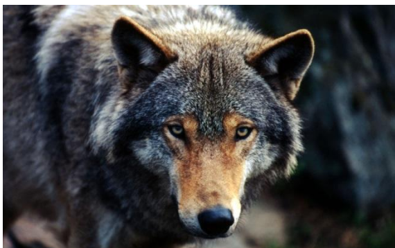
Wolf ( Canis lupus )

Auffällig bei Wölfen sind die deutlichen Variationen in der Fellfärbung. In seinem europäischen Verbreitungsgebiet ist das Wolfsfell grau bis bräunlich, im Nordwesten Amerikas auch schwarz und in der Arktis sowie in trockenen Gebieten auch sehr hell bis weiss. Der Wolf wird zwischen 100 und 160 Zentimeter lang und hat eine Schulterhöhe von 50 bis 100 Zentimetern. Die Tiere haben einen relativ massigen Körperbau. Wölfe in den kalten Regionen der Arktis sind am grössten, die Wölfe unserer Breiten haben eine mittlere Statur. Die kleinsten der Gattung kommen in den wärmeren Wüsten und Halbwüsten südlicherer Breiten vor. Der Europäische Wolf ist mit seinen 28 bis 38 Kilogramm kleiner als sein bis zu 80 Kilogramm schwerer nordamerikanischer Artgenosse. Die kleinen „Südwölfe“ wie der Arabische Wolf ( Canis l. arabs ) wiegen hingegen durchschnittlich nur 15 Kilogramm. Der Körperbau des Wolfes weist ihn als ausdauerndes Lauftier aus. Die typische Gangart des Wolfes ist der sogenannte geschnürte Trab, bei dem die Hinterpfoten exakt in den Abdruck der jeweiligen Vorderpfoten gesetzt werden. Wie alle Hundartigen haben die Wölfe fünf Zehen an den Vorderpfoten und nur vier an den Hinterpfoten, wobei jeweils nur vier Zehen und der Ballen abgedrückt werden.