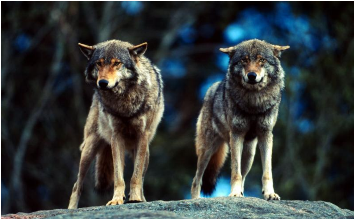
Wolf ( Canis lupus )