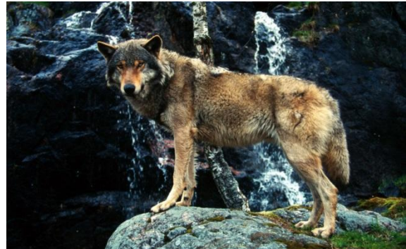
Wolf ( Canis lupus )

wildkälbern (mit 55 kg) pro Jahr. Die grossen Wölfe nördlicher Breiten haben einen höheren „Verbrauch“ als die kleineren, südlicheren Wölfe.